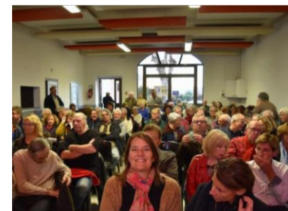
Salle des fêtes (100 personnes)