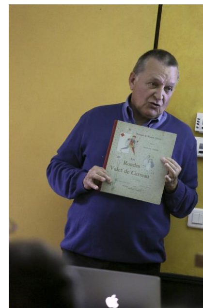
Au Musée de Montmartre, 2015