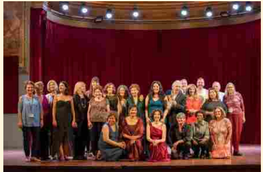
LA « CHICAGO-PARIS-CABARET CONNEXION » SUR LA SCÈNE DE LA SALLE MOLIÈRE