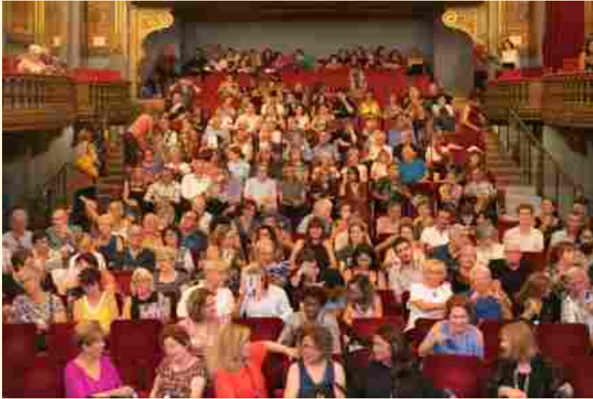
OPÉRA-COMÉDIE, MONTPELLIER, LA SALLE MOLIÈRE EST BIEN REMPLIE