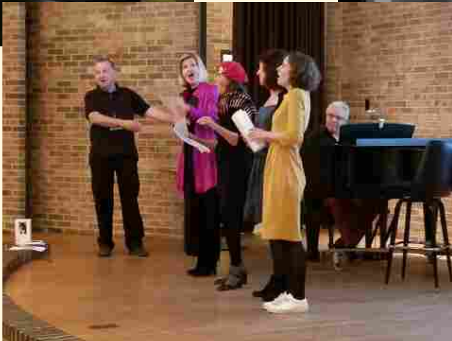
DEPAUL UNIVERSITY, SCHOOL OF MUSIC, CHICAGO, 2018