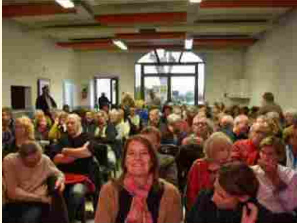
SALLE DES FÊTES (100 PERSONNES)