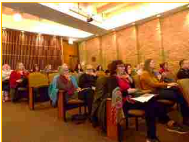
RECITAL HALL, DEPAUL SCHOOL OF MUSIC