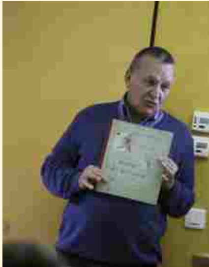
MUSÉE DE MONTMARTRE 2015