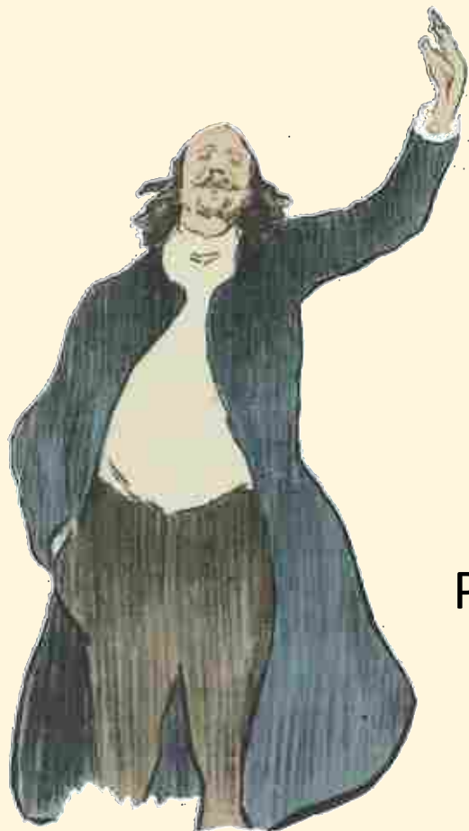
MARCEL LEGAY PAR IBELS